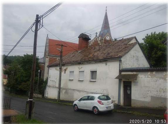
Régi homlokzat kép